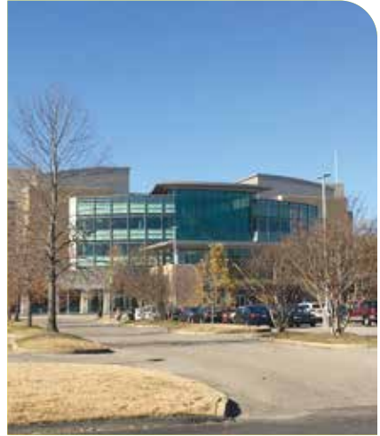
Benjamin L. Hooks Central Library - Memphis Public Library

531 Vance Ave. Memphis, TN 38126. (901)-415-2765.